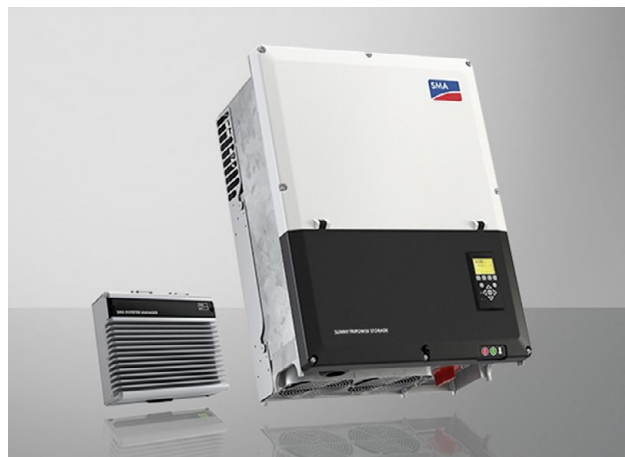
SMA Sunny Tripower Storage 60 mit SMA Inverter Manager